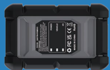
Phoenix Elite – VCI Dongle